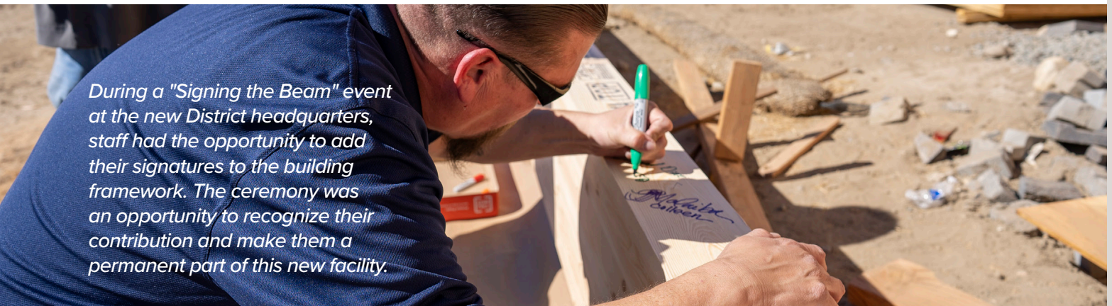
During a "Signing the Beam" event at the new District headquarters, staff had the opportunity to add their signatures to the building framework. The ceremony was an opportunity to recognize their contribution and make them a permanent part of this new facility.

Valley County Water District customers are eligible to participate in our rebate program. Visit us online or call 888-376-3314 for details.