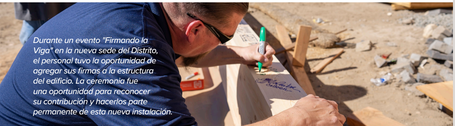
Durante un evento "Firmando la Viga" en la nueva sede del Distrito, el personal tuvo la oportunidad de agregar sus firmas a la estructura del edificio. La ceremonia fue una oportunidad para reconocer su contribución y hacerlos parte permanente de esta nueva instalación.

Valley County Water District los usuarios pueden participar en nuestro programa de reembolsos. Visítenos en línea o llámenos para obtener más detalles 888-376-3314.